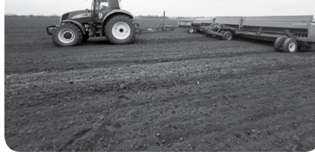
В весенне-полевых работах хозяйствами региона задействовано 33,6 тысячи единиц техники.

полного комплекса весенне-полевых работ, – отметил министр сельского хозяйства Ставропольского края Сергей Измаков.