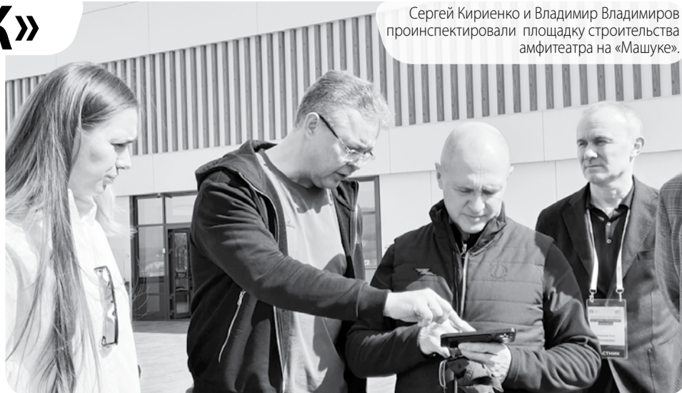
Сергей Кириенко и Владимир Владимиров проинспектировали площадку строительства амфитеатра на «Машуке».

Также замруководителя администрации президента РФ проинспектировал площадку строительства в центре амфитеатра на одну тысячу зрителей и обсудил с губернатором Владимиром Владимировым вопросы, связанные с завершением работ и дальнейшей эксплуатацией объекта. Как